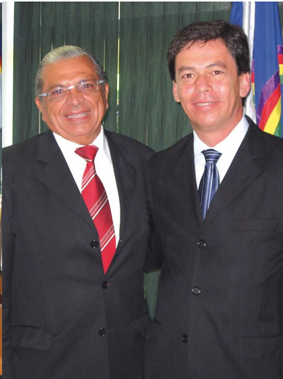
Prefeito reeleito do Município de Pedra, Francisco Braz - PR / PE