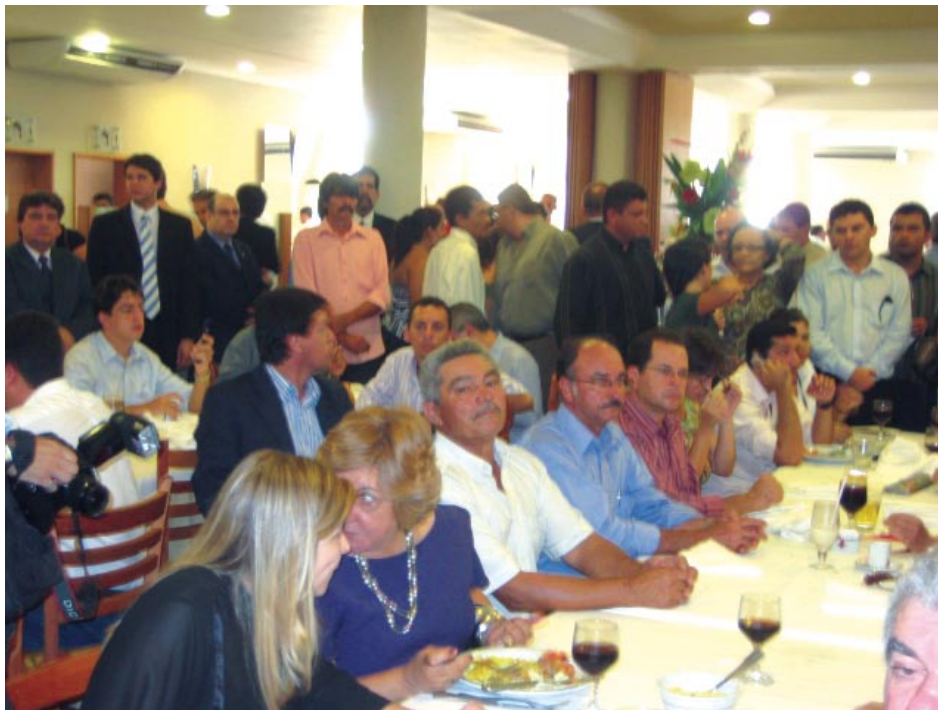
Eleitores parabenizam o deputado no restaurante Boi Preto, no último dia 21 de outubro.

Desde o trabalho árduo de aprendizado da dinâmica do Congresso Nacional em Brasília, no início do man-